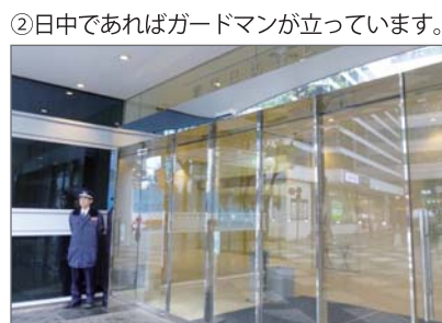
(B2~3階) 商業施設「日比谷シャンテ」入口